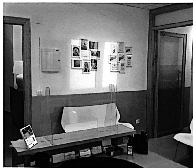
Sala de espera y Recepción.